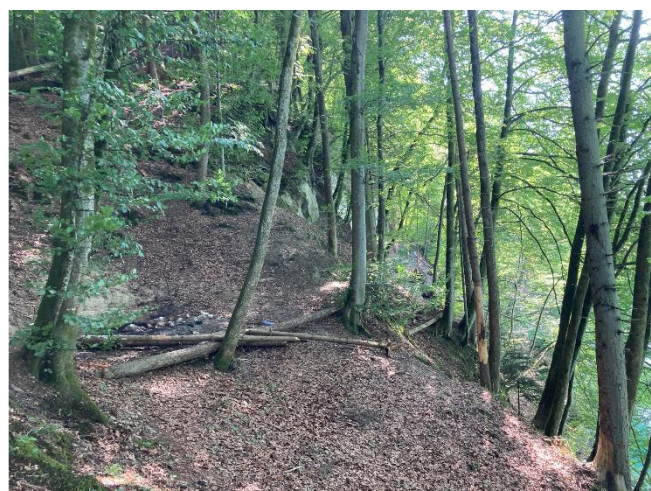
Bild 2: Waldabschnitt mit Felsbändern und nicht offiziellen Feuerstellen