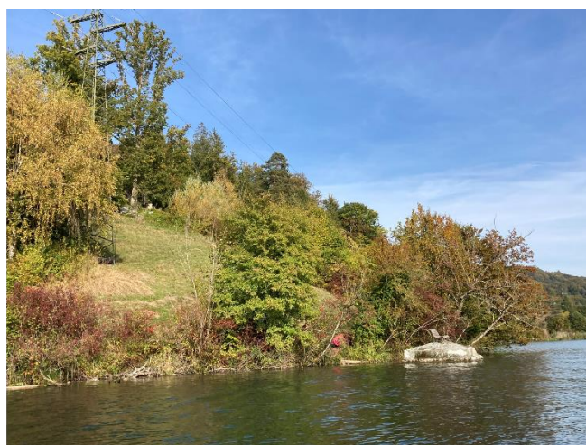
Bild 2: Freileitung über Parzellen mit privater Nutzung bis ans Wasser