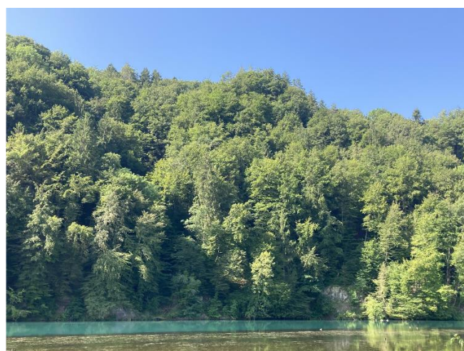
Bild 1: Natürlicher Mündungsbereich, stark beschattet, mit privater Feuerstelle und etwas Biberfrass Bild 2: Steiler unzugänglicher Waldabschnitt