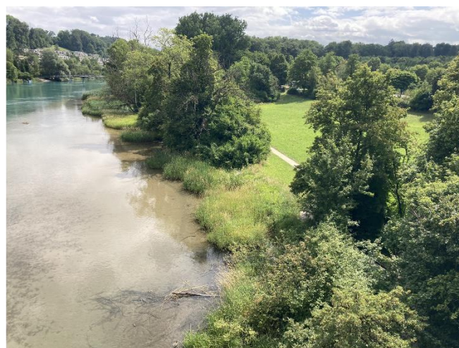
Bild 2: Vielfältiger natürlicher Uferabschnitt mit Gehölz, Schilf- und Seggenbeständen