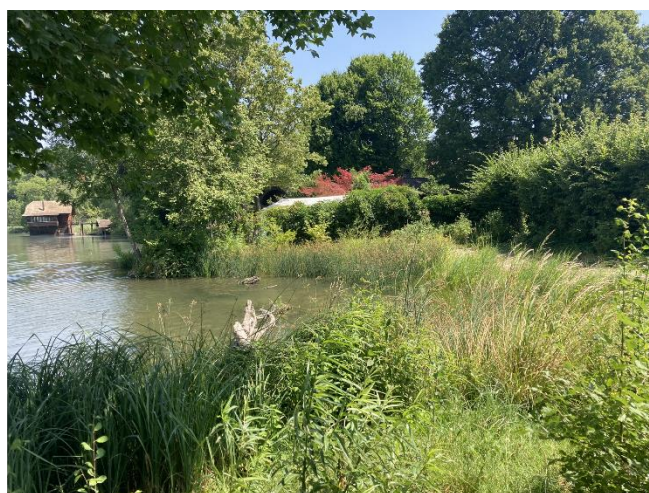
Bild 2: Neu aufgewerteter Uferbereich nach Rückbau Bootshaus Seepolizei