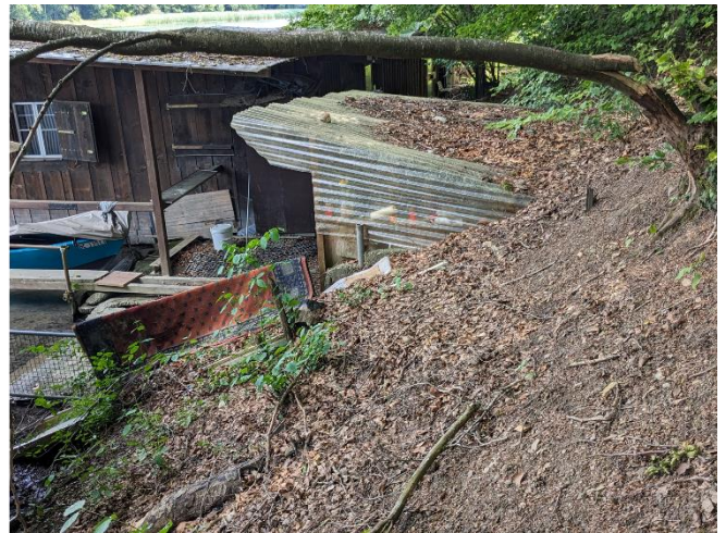
Bild 2: Biberaktivität um Bootshäuser; stark verbauter Uferabschnitt